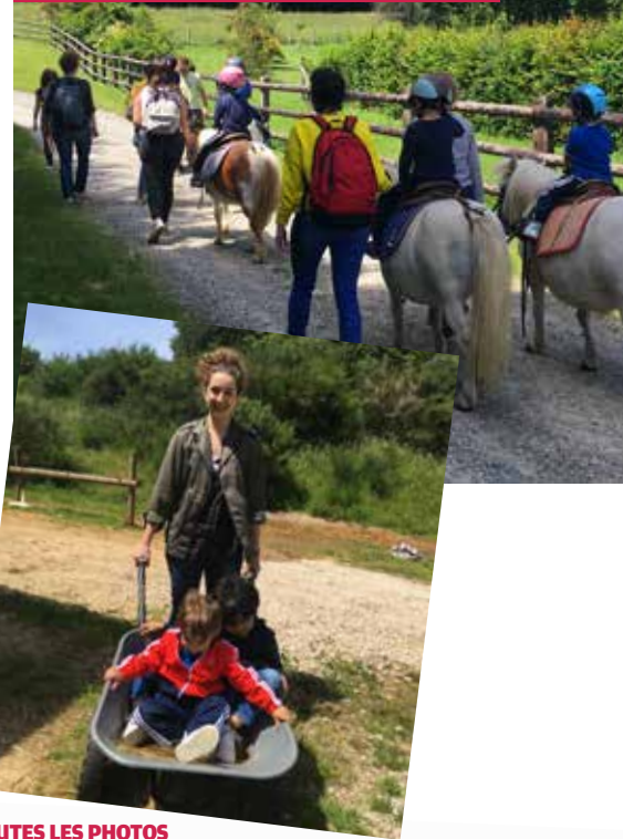
TOUTES LES PHOTOS SUR LE SITE WWW.JES-FRANKLIN.ORG

Séjour d'équithérapie de la Classe Soleil, les 20 et 21 juin à Montligeon, financé grâce aux participants à « Une dictée pour la Classe Soleil ».